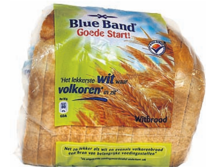
Het lekkerste wit waar...ja, wat zit er eigenlijk in? FOTO GPD

Vorig jaar werd het Gouden Windeï voor het eerst uitgereikt aan yoghurtdrinkje Actimel. (GPD)